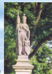
Socha sv. Václav v Nádražní ulici