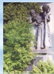
Pomník padlým v I. světové válce „Poutník u cíle“